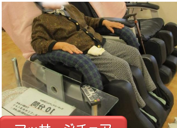
マッサージチェア 全身もみほぐし