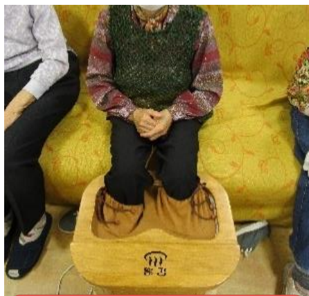
赤外線足浴 指先からぽかぽか