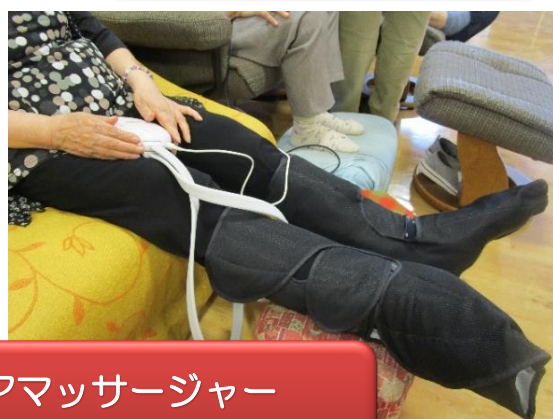
エアマッサージャー 血行促進・疲労回復