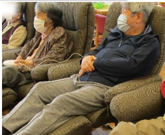
エアマッサージャー& リクライニングソファ でゆったり