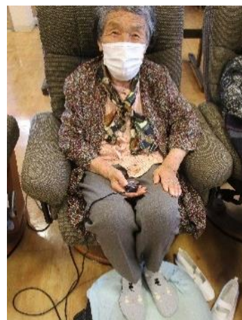
足裏マッサージ器 足裏トントン