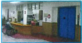
1階ケアステーション