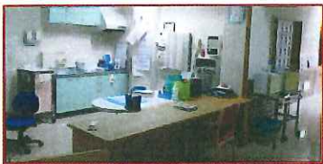
2階ケアステーション