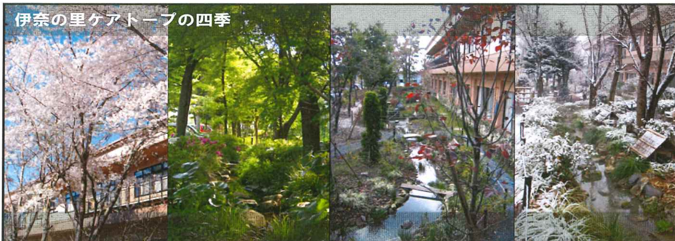
伊奈の里ケアトープの四季