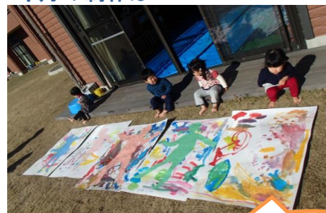
～等身大の自分の絵～