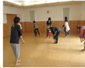
「お手でくるくる～」 真似っこ上手♡♡