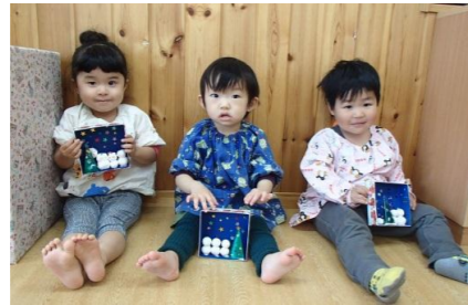
可愛い作品が出来上がりました★