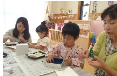
細かな作業に真剣な表情☆ ママの方が夢中になっていました!