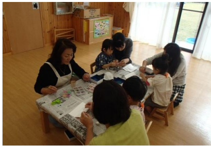
紙粘土を丸めて雪だるまを作りました。