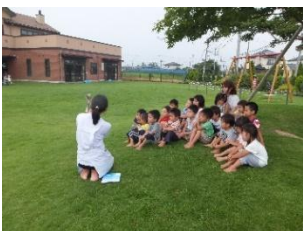
おそとで絵本も気持ちいい