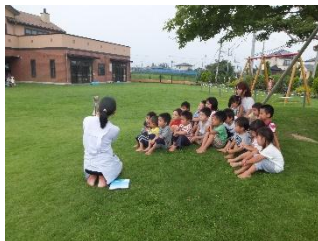
おそとで絵本も気持ちいい