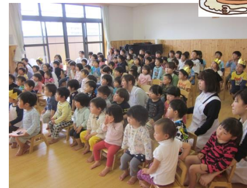
集会の参加がとても上手になりました。