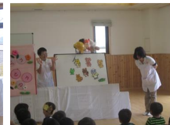
インタビューにもはっきりこたえます