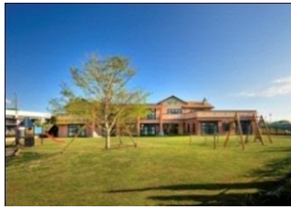
みどりの芝生はだしてあそぼ