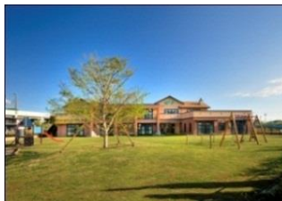
みどりの芝生はだしてあそぼ