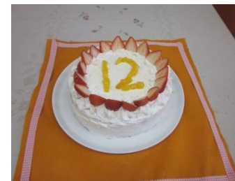
12月誕生祝会のケーキです。

毎月第三水曜日の予定で全園児がホールに集い、誕生児をお祝いします。ご本人の誕生日当日は「ぐりとぐらからおたんじょうびおめでとう」の本を皆さんからのメッセージも頂き、プレゼントさせて頂きます。クラスでは1ヶ月間誕生カードを飾ります。集会では歌をうたったり、職員の出し物を観たり楽しいひと時を過ごします。昨年毎月とても好評でした。誕生会での出し物は職員が工夫を凝らし、良い文化を伝える機会にしていきたいと思ひています。