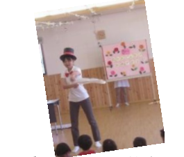
マジックショーの始まり～

誕生祝会には栄養士さん手作りのデコレーションケーキが各クラスに届けられ、ナイフで切って頂きます。