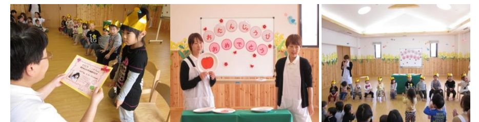
4月の誕生会の様子です