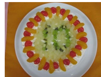
(10月の誕生会の様子です) 誕生祝会には栄養士さん手づくりのデコレーションケーキが各クラス毎に届けられ、ナイフで切って頂きます。

毎月第三水曜日の予定で全園児がホールに集い、誕生児をお祝いします。ご本人の誕生日当日は「ぐりとぐらからおたんじょうびおめでとう」の本を皆さんからのメッセージも頂き、プレゼントさせていただきます。クラスでは1ヶ月間誕生カードを飾ります。集会では歌をうたったり、職員の出し物を観たり楽しいひと時を過ごします。昨年も毎月とても好評でした。誕生会での出し物は職員が工夫を凝らし、良い文化を伝える機会にしていきたいと思っています。