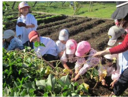
レッツポテトパーティ

レッツポテトパーティでは4・5歳児が白菜をちぎったり、調理のお手伝いをした後で、カマドで薪を燃やしお鍋でぐつぐつ煮えるのを見ながら、会食を待ちました。園庭でのバイキング形式の会食は何杯もお変わりをしているお子さんもいました。